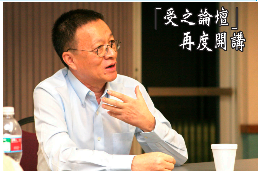
▲ 11 月 1 日，知青協會邀請著名評論家王受之教授，專題演講「我的文革經歷和知青歲月」，大家共同回顧 40 年前的風風雨雨。王受之教授的精彩演講吸引了眾多知青朋友。(文字說明：邱新睦)